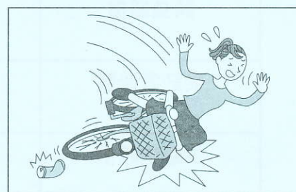
仕事に従事するため、仕事場所と会員の 住居との間の行き帰り中のケガ

傷害事故の他に、(日射または熱射によって、シルバー人材センターの会員が身体に障害を被った場合)熱中症による入院(手術)・通院・死亡・後遺障害も補償します。