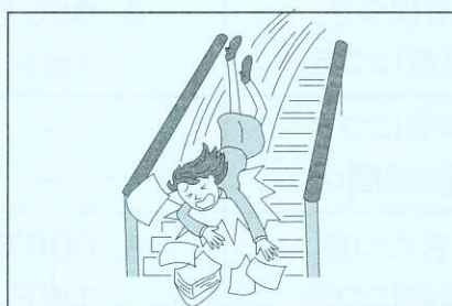
センター等が主催する就業の一環である ボランティア活動に参加中のケガ